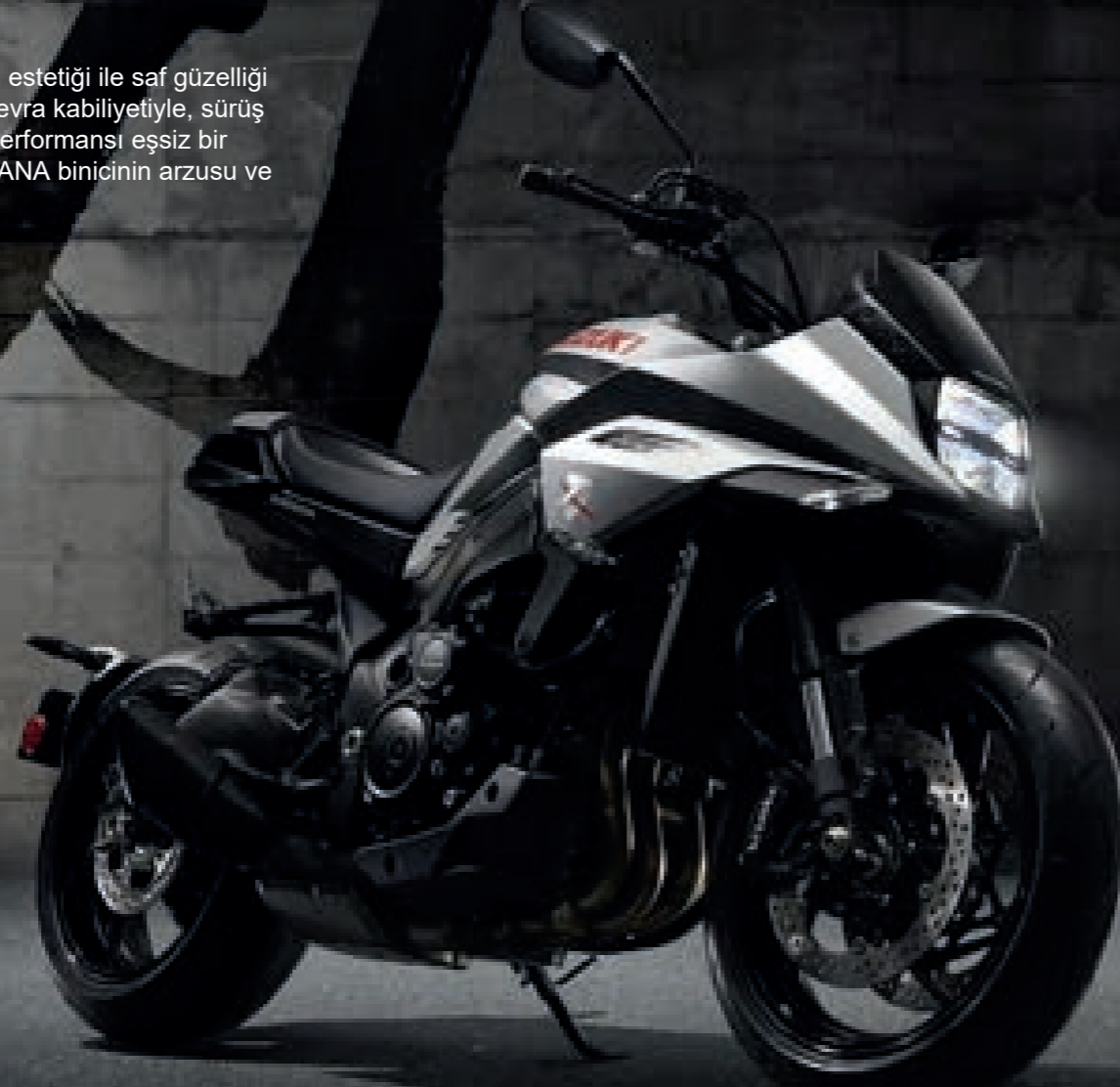
Metalik Mistik Gri (YMD)

Son derece güzel ve kullanması inanılmaz keyiflidir. Modern Japon estetiği ile saf güzelliği keskin bir tasarımda bir araya getiren bir ince işçilik timsalidir. Manevra kabiliyetiyle, sürüş kolaylığıyla ve konforla en uygun şekilde dengelenmiş olan güçlü performansı eşsiz bir kullanım keyfi sunar. Sürüş tarzınız nasıl olursa olsun, Suzuki KATANA binicinin arzusu ve ruhunun doğal bir uzantısıymışçasına son derece iyi hissettirir.